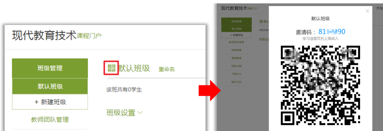
图2-1 电脑端查看班级二维码和邀请码

学生加入班级方法： 打开学习通——“首页”，点击右上角图标“邀请码”，扫描老师提供的二维码或输入邀请码，即可加入课程。