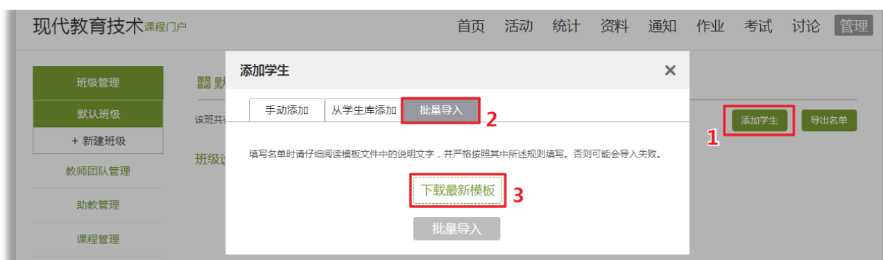
图1-2 “批量导入学生”步骤