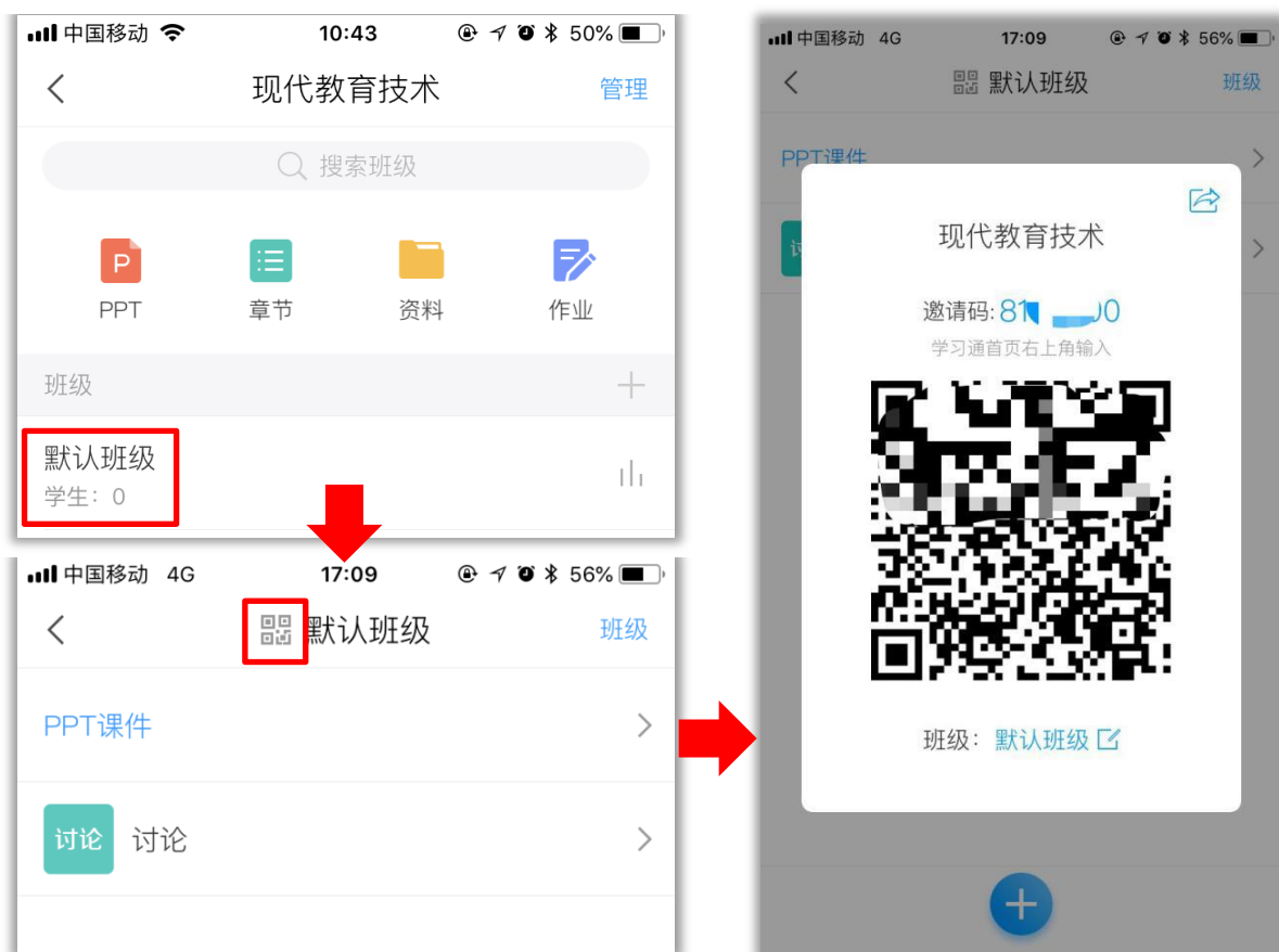
图2-2 手机端查看班级二维码和邀请码